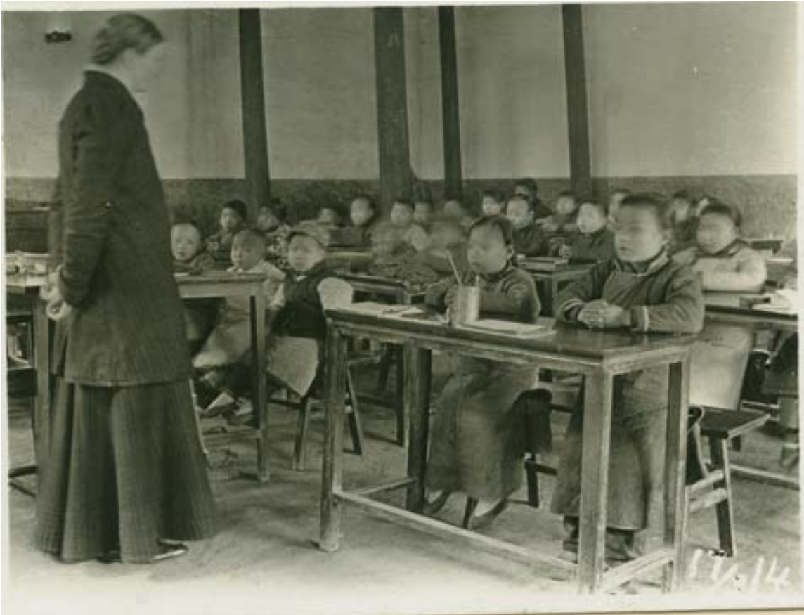
1914